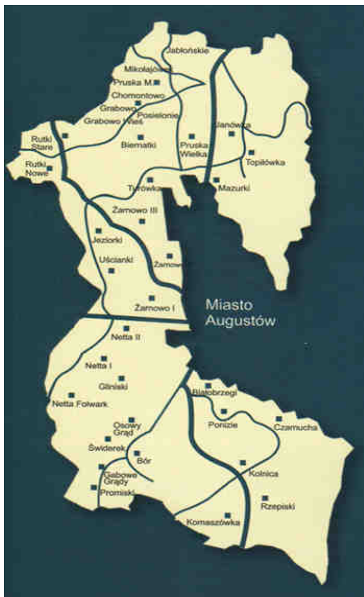
Mapa Gminy Augustów

Specyfikę problemów występujących na terenie Gminy Augustów można określić w następujący sposób: