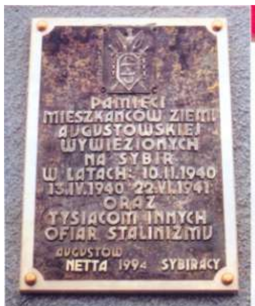
Tablica pamiątkowa przy Szkole Podstawowej im. Sybiraków w Netcie.