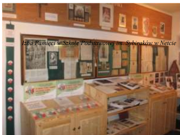
Izba Pamięci w Szkole Podstawowej im. Sybiraków w Netcie