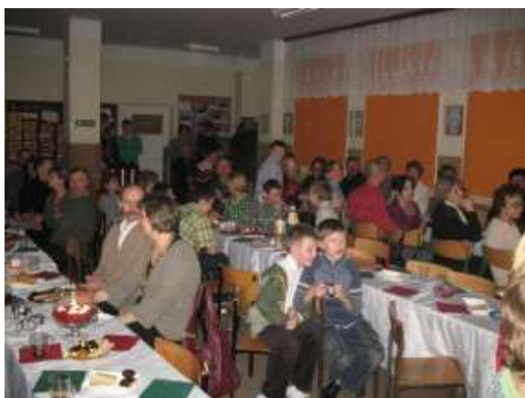
Wieczornica walentynkowa z udziałem rodziców uczniów

Zabawy karnawałowe typu: choinka, bal przebierańców to dla niektórych mieszkańców jedyna rozrywka towarzyska i kulturalna. Wieczornica Walentynowa cieszy się wśród mieszkańców zainteresowaniem i wysoką frekwencją.