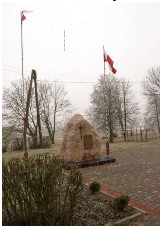
Obelisk przy Szkole Podstawowej im. Sybiraków w Netcie.

Wieś posiada bogate tradycje patriotyczne. Jej mieszkańcy brali udział we wszystkich powstaniach narodowych. W czasie odzyskiwania niepodległości przez Polskę wielu mieszkańców wstąpiło w szeregi Polskiej Organizacji Wojskowej i brało udział w wojnie z bolszewikami. W czasie II wojny światowej służyli w partyzanckich oddziałach AK oraz w regularnych formacjach na wszystkich frontach. W tym czasie część mieszkańców została wywieziona na Syberię razem z mieszkańcami wsi Netta Folwark i Netta Druga. W 1994 roku w 54 rocznicę wywózki mieszkańców Netty na Syberię Szkoła Podstawowa przyjęła imię Sybiraków. Od tego czasu pamięć o tych, którzy przebywali na „Nieludzkiej Ziemi” jest pielęgnowana przez nauczycieli, uczniów i ich rodziców w sposób szczególny. Powstała izba pamięci, w której są gromadzone pamiątki nie tylko z pobytu na Syberii ale również z okresu II wojny światowej. Przed budynkiem szkoły stanął obelisk z tablicą poświęconą mieszkańcom ziemi Augustowskiej wywiezionych na Sybir.