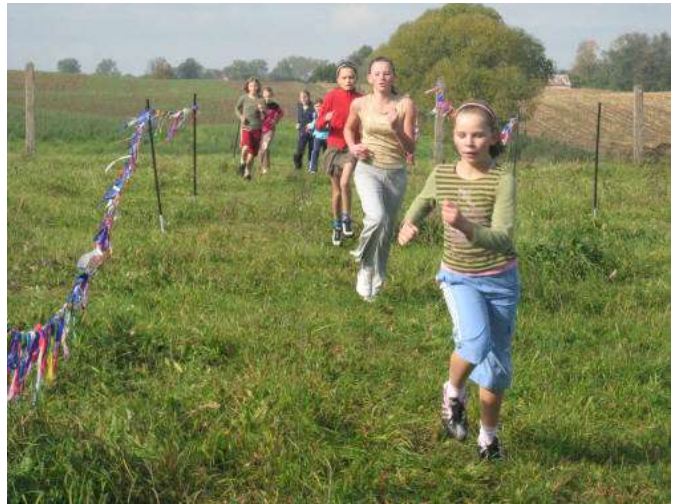
Festyn sportowo- rekreacyjny z udziałem uczniów i rodziców: