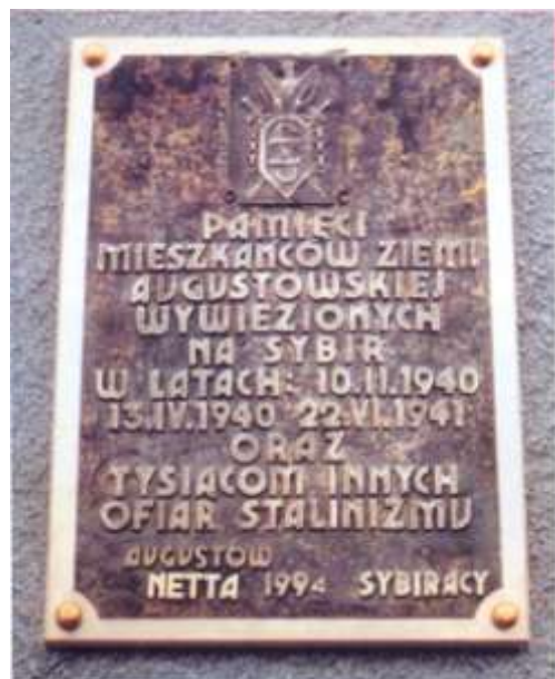
Obelisk i tablica pamiątkowa przy Szkole Podstawowej im. Sybiraków w Necie.