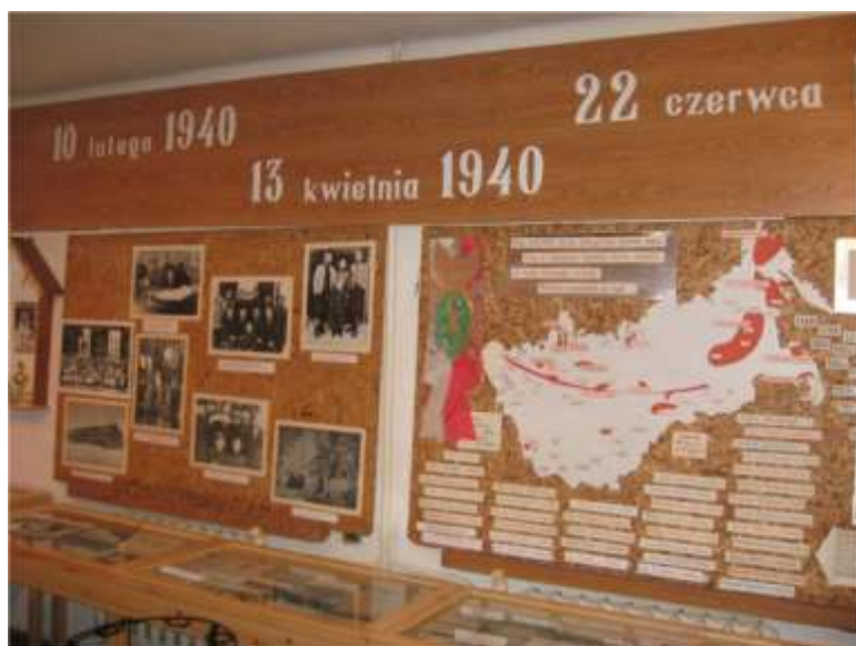
Izba pamięci w Szkole Podstawowej im. Sybiraków w Netcie.