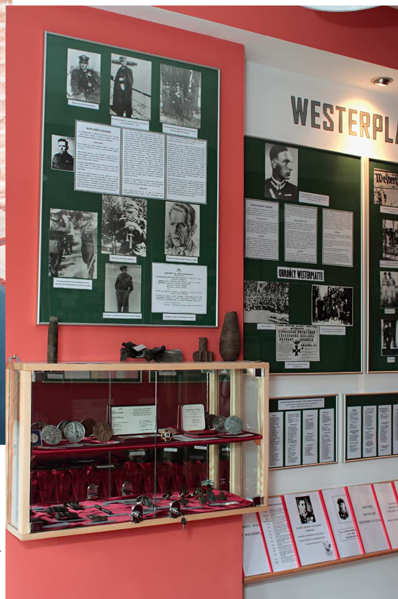
Zgromadzone zbiory w odnowionej Szkolnej Izbie Pamięci.

W jednej z klas zgromadzono także eksponaty, które służyły rolnikom do pracy w ubiegłym wieku. Szkołę odwiedzają też ciekawi ludzie, którzy w szczególny sposób przekazują młodemu pokoleniu żywe lekcje historii. Większość uroczystości odbywa się w szkole lub na jej terenie – boisku szkolnym.