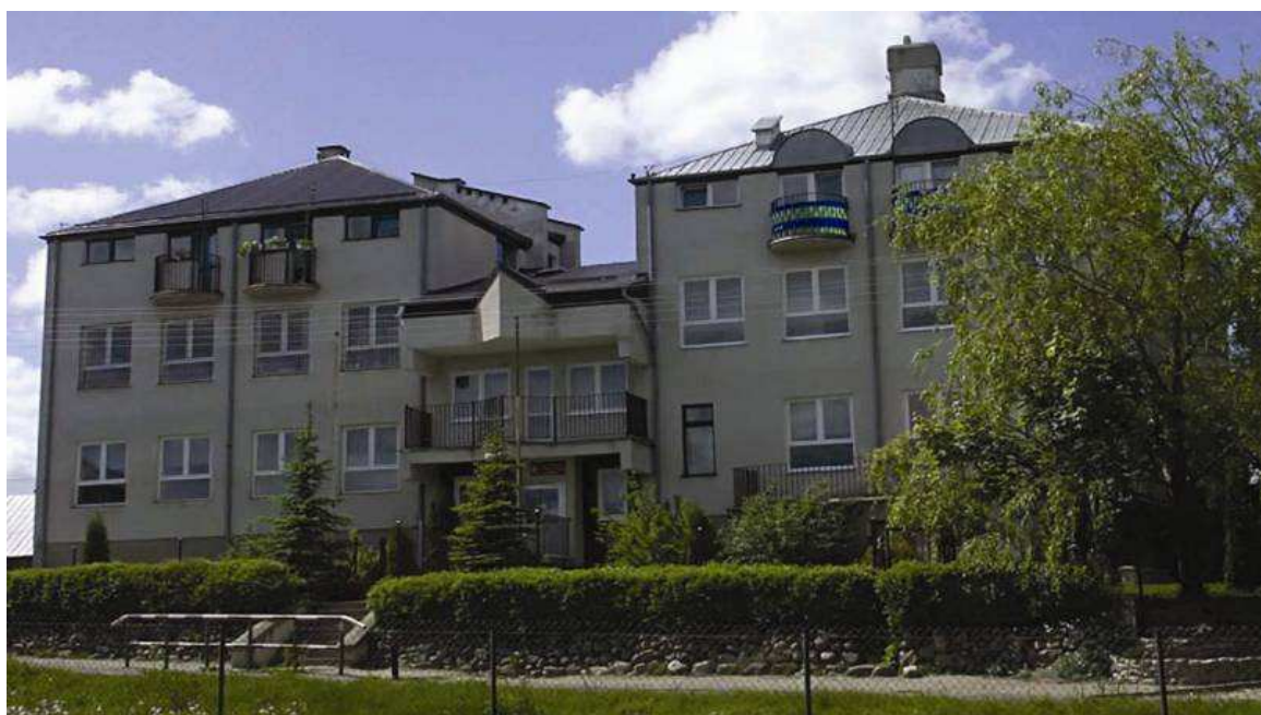
Budynek Szkoły Podstawowej im. Obrońców Westerplatte w Rutkach usytuowany na granicy wsi Rutki Stare i Rutki Nowe.

Ważnym wydarzeniem w środowisku Rutek była w 1998 r. uroczystość nadania miejscowej szkole imienia Obrońców Westerplatte oraz nowego sztandaru.