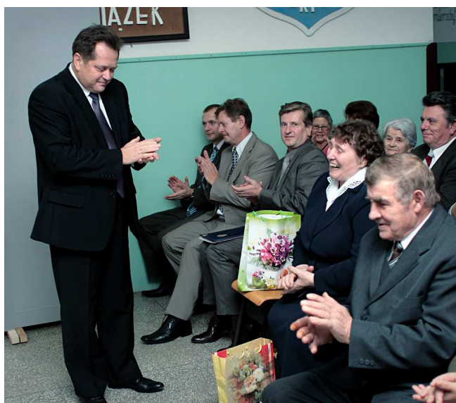
Dzień Seniora. Poseł na Sejm Rzeczypospolitej Polskiej Jarosław Zieliński jest częstym gościem na ważnych uroczystościach szkolnych.