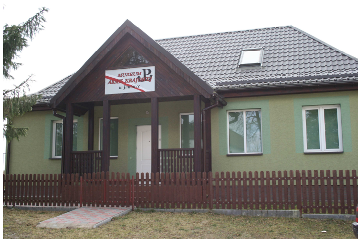
Muzeum Armii Krajowej w Janówce