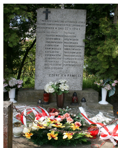
Pomnik pomordowanych mieszkańców wsi Janówka