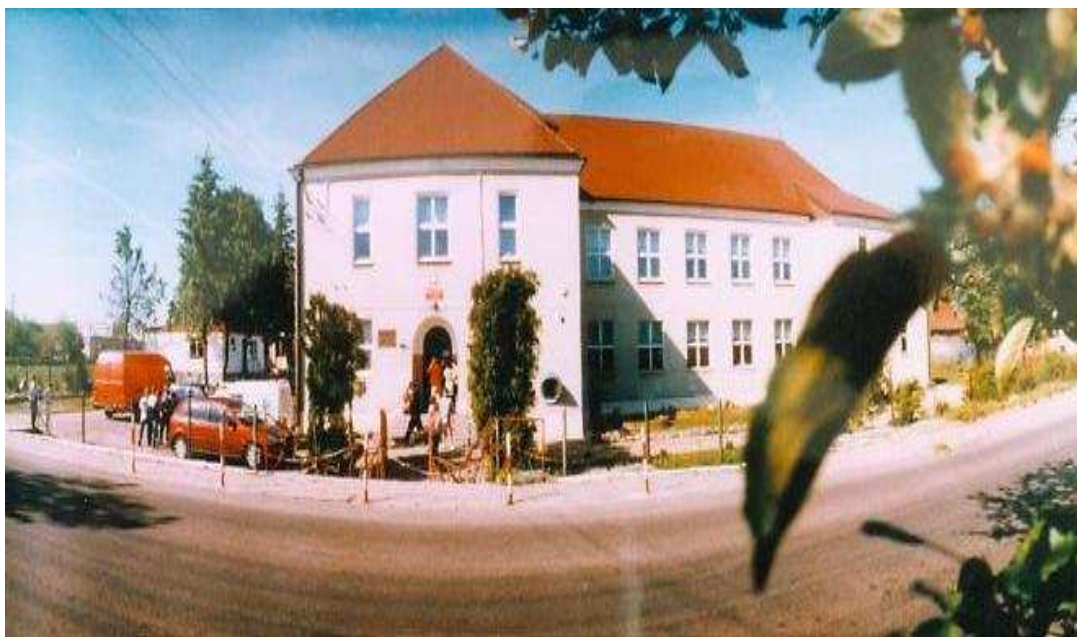
Szkoła Podstawowa im. Armii Krajowej