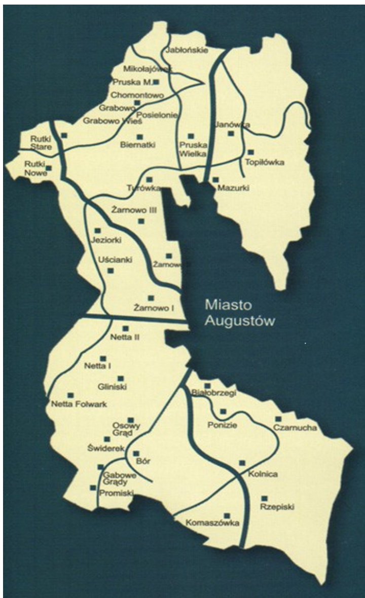
Mapa Gminy Augustów

Głównymi problemami występującymi w gminie jest alkoholizm i bezrobocie, a z tym wiąże się występowanie przemocy w rodzinie. Kolejnym problemem wynikającym z badań jest okazjonalne i eksperymentalne używanie środków psychoaktywnych przez młodzież Gminy Augustów. Poniżej przedstawiamy wyniki badań: