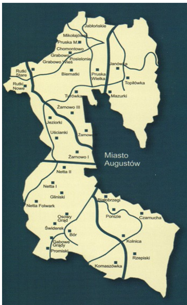
Mapa Gminy Augustów

Głównymi problemami występującymi w gminie jest alkoholizm i bezrobocie, a z tym wiąże się występowanie przemocy w rodzinie. Kolejnym problemem wynikającym z badań jest okazjonalne i eksperymentalne używanie środków psychoaktywnych przez młodzież Gminy Augustów. Poniżej przedstawiamy wyniki badań: